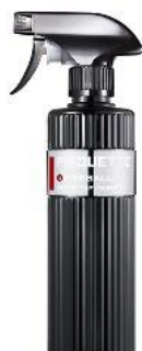
WOSK W PŁYNNIE - PREMIUM FIREBALL PIROUETTE