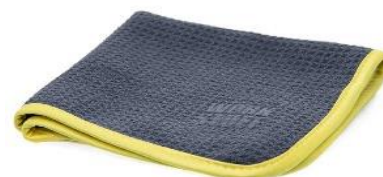
MIKROFIBRA DO SZYB WORK STUFF ZEPHYR TOWEL