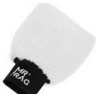
RĘKAWICA DO MYCIA MR RAG RĘKAWICA

Kliknij w linki i sprawdź polecane przez MOTOGO produkty: