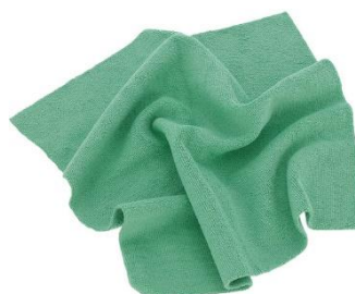
WIELOZADANIOWA MIKROFIBRA MR RAG BLUE 380GSM