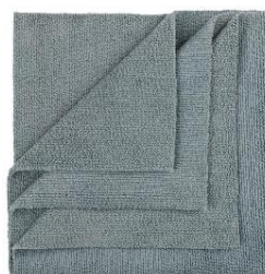
MIKROFIBRA BEZSZWOWA MR RAG 40X40cm