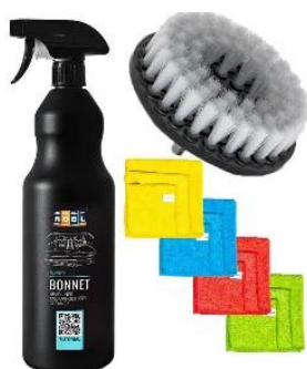
CZYSZCZENIE TAPICERKI ADBL BONNET ZESTAW