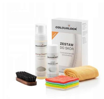
CZYSZCZENIE SKÓRY COLOURLOCK ZESTAW