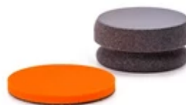
RĘCZNE POLEROWANIE ZVIZZER HANDPUK + PUKPAD