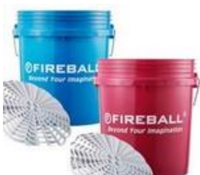
WIADRA Z SEPARATORAMI FIREBALL ZESTAW WIADER