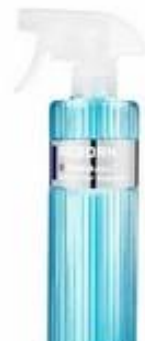
ODTŁUSZCZENIE LAKIERU FIREBALL REBORN