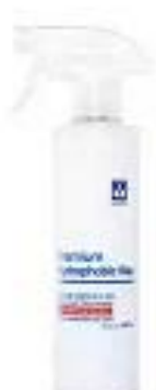
WOSK W PŁYNNIE - ŁATWY BINDER HYDROPHOBIC WAX

Kliknij w linki i sprawdź polecane przez MOTOGO produkty: