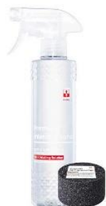
CZYSZCZENIE WNĘTRZA BINDER INTERIOR CLEANER

Kliknij w linki i sprawdź polecane przez MOTOGO produkty: