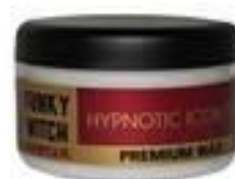
TWARDY WOSK - ŁATWY FUNKY WITCH HYPNOTINC ICON