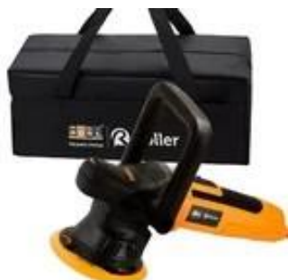
MASZYNA POLERSKA ADBL ROLLER