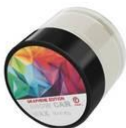
TWARDY WOSK – PREMIUM FIREBALL GRAPHENE SHOW WAX