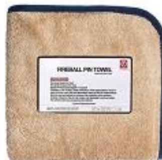
RĘCZNIK DO OSUSZANIA FIREBALL PIN TOWEL