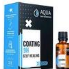
POWŁOKA CERAMICZNA AQUA COATING