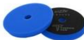
PADY POLERSKIE ZVIZZER THERMO